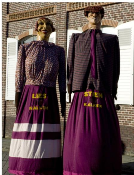
Kalken - Reuzen Stien en Lies Herdenkingsjaar 1960-2010

Meerdere verenigingen dragen een steentje bij: dekenij K3+ zorgt voor de bediening tijdens de receptie ter hoogte van de vroegere herberg van Stien en Lies, de Koninklijke Harmonie Sint-Cecilia Kalken zorgt voor de muzikale noot, feestcomité De Keille zorgt ervoor dat de reuzen kunnen dansen en Reuzencomité Kalken en de Stichting Sint-Pietersfeest Kalken zorgen voor de drank tijdens de receptiemomenten.