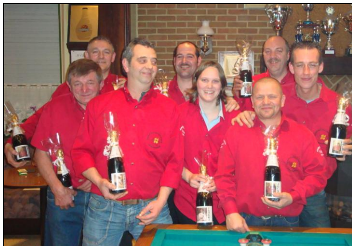
Illustratie 4. De kampioenen van Harmonie B.