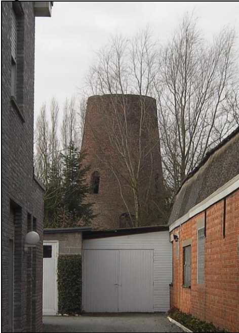
Illustratie 2. De molenromp vanuit de Schriekstraat gezien.

Bovenop de huidige molenromp bevond zich vroeger het gevluht: de wieken met aanvankelijk een windvang in doek en later in aluminium. Het systeem om de wieken met aluminiumplaten te bedekken, en zo een beter rendement te bekomen, werd bedacht door de Nederlander Dekker. De verdekking van de molen werd in 1933 plechtig gevierd. Een verwijzing naar dat feest was al eens door buur Floris Dhooghe gemaakt, maar onlangs hebben we over dat feest een korte vermelding aangetroffen in een Nederlandse krant, met name het Leidsch Dagblad van donderdag 21 september 1933.